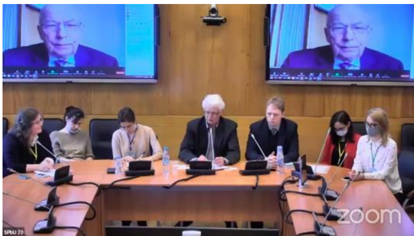
Рис. 2. Открытие конференции (онлайн формат). Оргкомитет. Fig. 2. Opening of the conference (online). Organizing committee.

На конференцию поступило около 200 заявок от студентов, аспирантов, молодых ученых, в том числе от 30 школьников, практически со всех регионов России (Москва, Санкт-Петербург, Ростов-на-Дону, Красноярск, Казань, Якутск, Тюмень, Владивосток, Новосибирск, Нижний Новгород и др.), а также из стран ближнего и дальнего зарубежья, в их числе Чехия, Турция, Италия, Украина, Беларусь, Казахстан, Узбекистан. С приветственными словами выступили крупные ученые из России, Азербайджана, Беларуси, Казахстана, Кыргызстана, Узбекистана. С приветственным словом и заказным докладом выступила Президент международного союза наук о почве – Laura Bertha Reyes Sánchez.