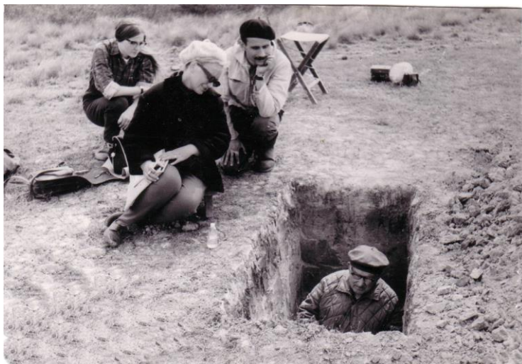
В почвенном разрезе. Джаныбекский стационар. 1972 г.

В настоящем номере публикуются научные статьи почвоведов, лесоводов, зоологов, которые считают себя учениками А.А. Роде, развивают его идеи, следуют его заветам, сохраняют его школу.