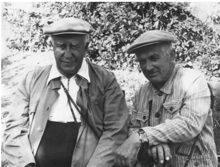
А.А. Роде и академик В.Н. Сукачев. 1959 г.