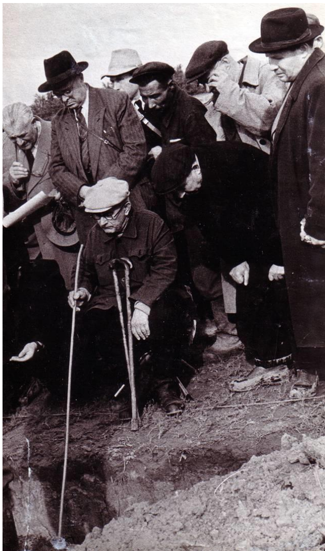
Полевая экскурсия на Джаныбекском стационаре. 1961 г.