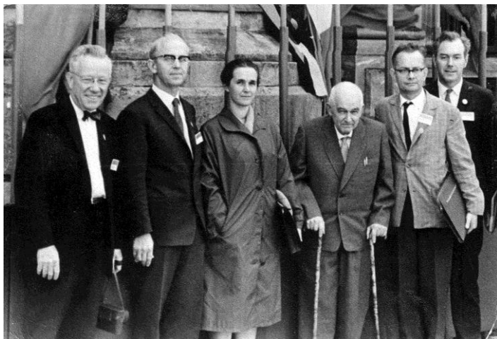
Среди участников Международного конгресса почвоведов. Румыния. 1964 г.