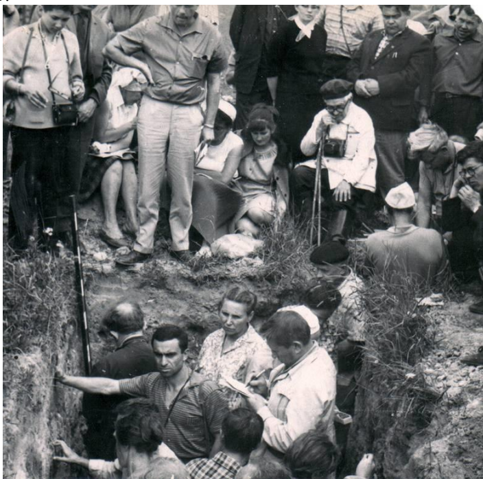
Дискуссия у почвенного разреза. Всесоюзный съезд почвоведов. Эстония, г. Тарту. 1966 г.