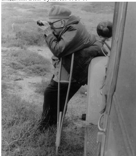
В Прикаспии на озере Эльтон. 1961 г.